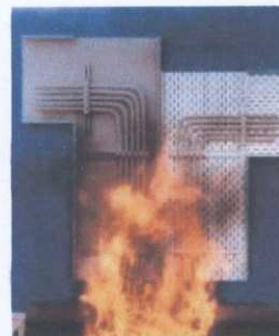
Linke Seite mit cp Beschichtung Rechte Seite ohne cp Beschichtung

Mit Hapuflam® cp verringert sich aktiv die Brandlast.